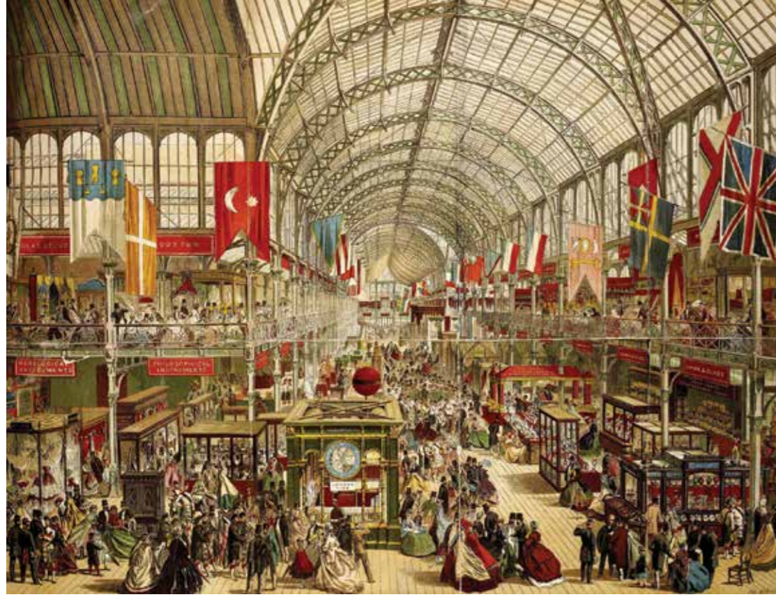
Londra Fuarı, 1851