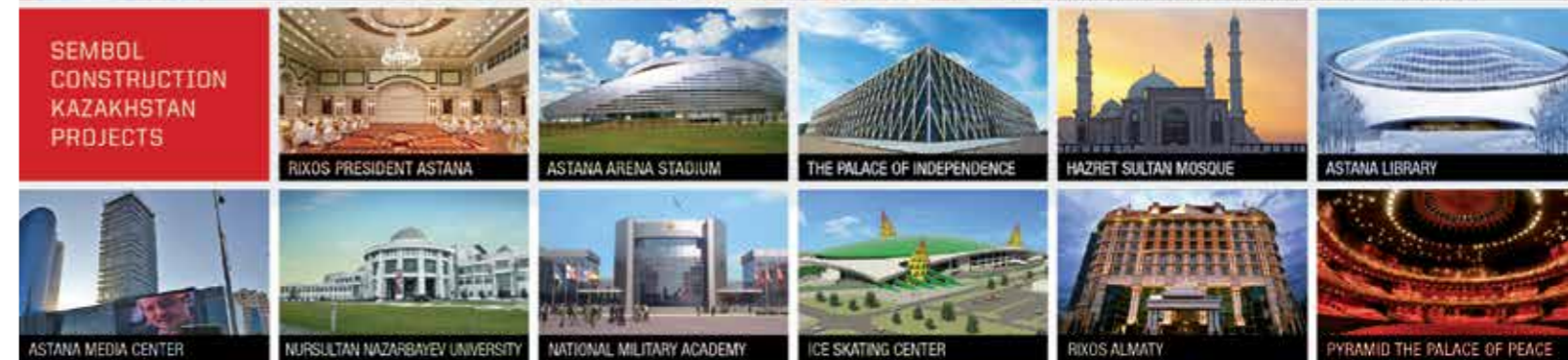
KHAN SHATYR SHOPPING & ENTERTAINMENT CENTER